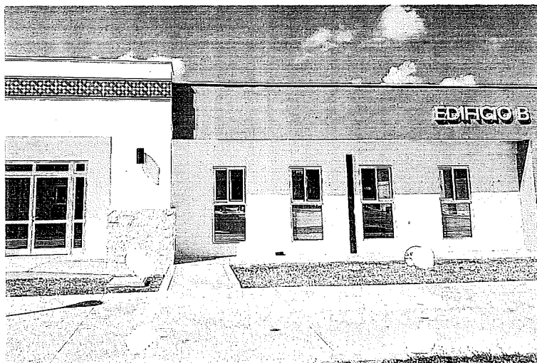
Comenzó a prestar servicios desde el pasado 6 de mayo del presente año.

Cabe destacar que la apertura de este edificio a cargo de la Secretaría de Relaciones Exteriores contribuirá a reducir la demanda